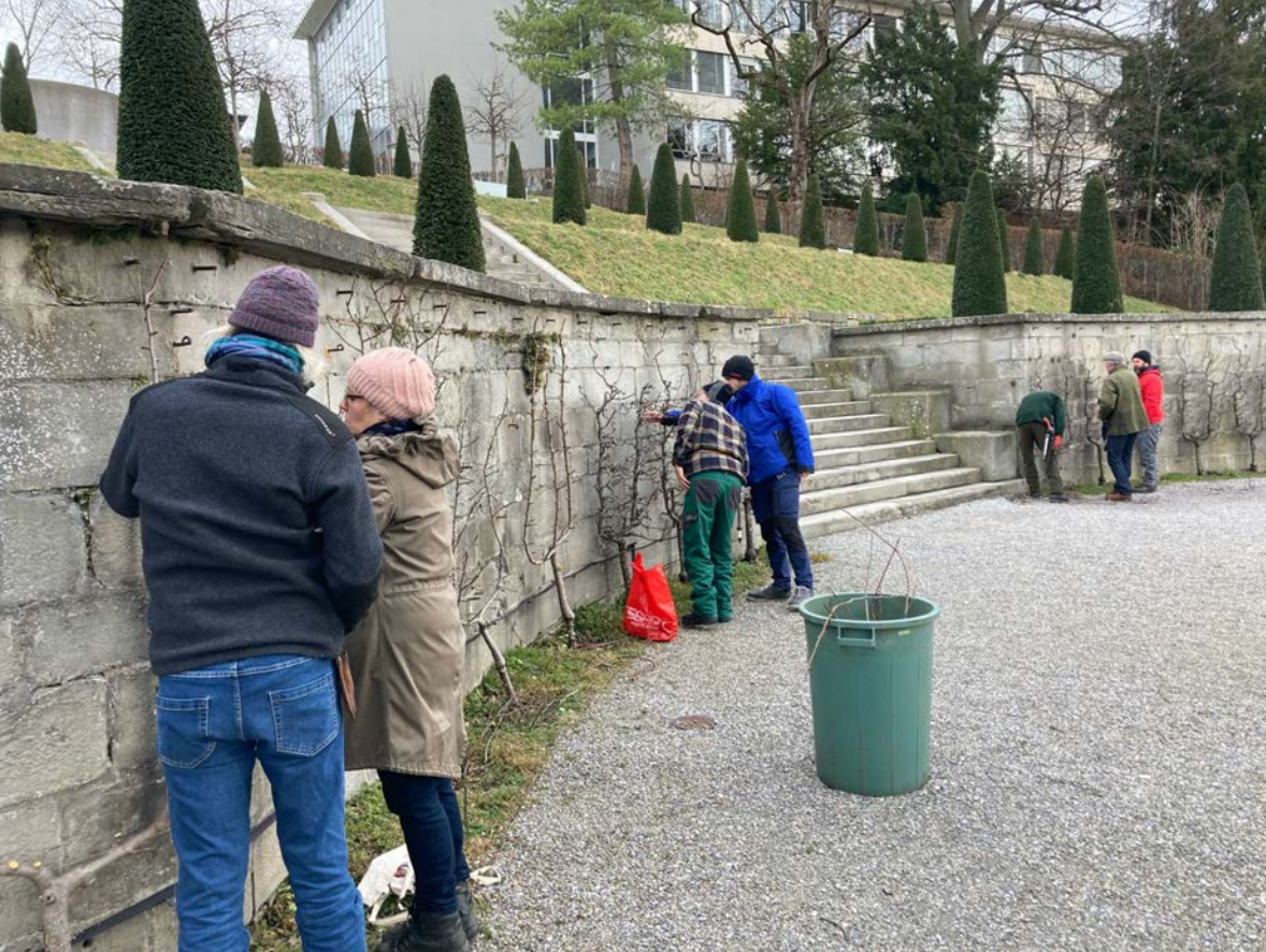
Février 2023 : le groupe en action Au Rechberg-Garten à Zürich.

À la fin juin 2023, une partie du groupe s'est donc réunie pour la taille d'été dans ce jardin public.