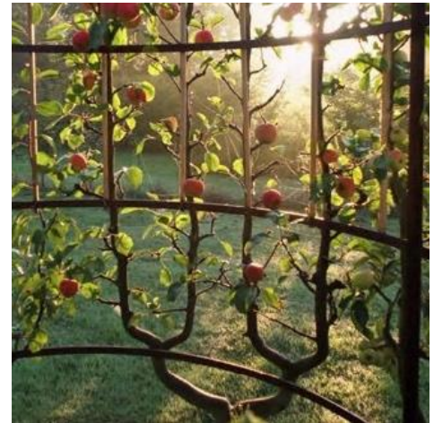
Emblème du collectif L'art de l'espalier